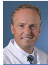
Franz Kralinger Wilhelminenspital der Stadt Wien, Unfallchirurgie, Wien, Österreich